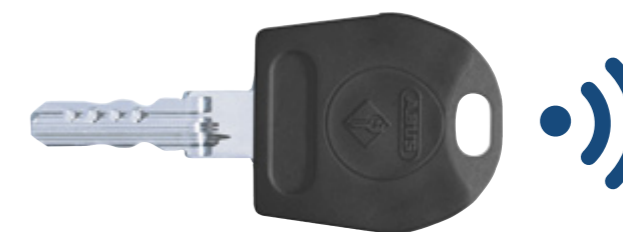
Elektronik & Mechanik

Ein Pluspunkt ist die Kombinierbarkeit mit mechanischen Schließsystemen von ABUS Pfaffenhain. Mit dieser Kombination kann man ein sinnvolles Gesamtkonzept erstellen und auch bei einem schmalen Budget eine interessante Lösung schaffen. Durch einen Kombischlüssel ist das sogar mit nur einem Schließmedium möglich.