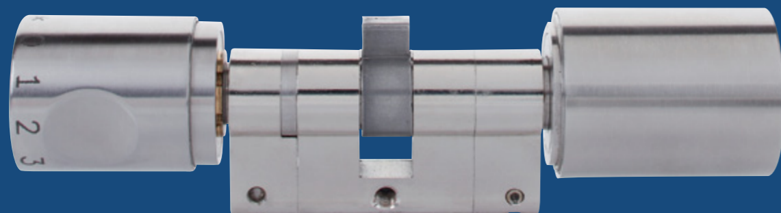
Eingabe geistiger Codes

Neben der Anschaffung zu einem guten Preis-Leistungs-Verhältnis zählen für uns dazu vor allem Skalierbarkeit, Zuverlässigkeit und Langlebigkeit. Ein System von ABUS Seccor wächst mit Ihrem Unternehmen. Hochwertige Materialien, die Fertigung »Made in Germany« und der Einsatz moderner Technologie gewährleisten einen dauerhaften und zuverlässigen Einsatz im Objekt. So setzen Sie mit ABUS Seccor auf eine wirtschaftliche, berechenbare Lösung.