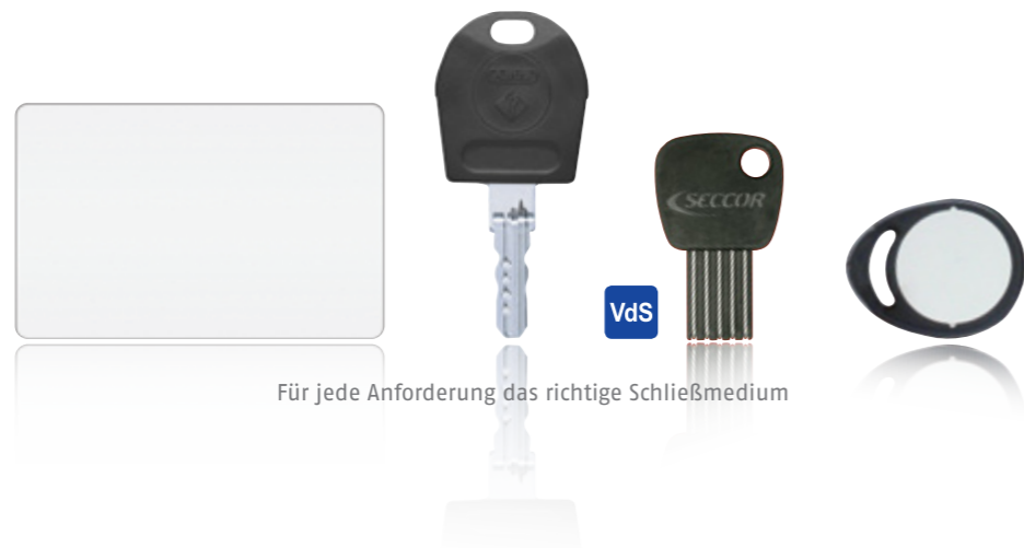
Für jede Anforderung das richtige Schließmedium