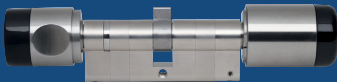
Funksteuerung der Einbruchmeldeanlage

Daher hat ABUS Seccor bei der Entwicklung von Zylindern, Bedienkomponenten und der Software besonders auf die Benutzerfreundlichkeit Wert gelegt. Ein weiterer Pluspunkt ist, dass die Bedienung verschiedener Systeme mit nur einem Medium möglich ist: Ob elektronische Zylinder von ABUS Seccor, mechanische Zylinder von ABUS Pfaffenhain, die Zeiterfassung, die Alarmanlage oder andere Fremdsysteme – alles lässt sich mit nur einem Schlüssel bedienen. Einfacher und sicherer geht es nicht!