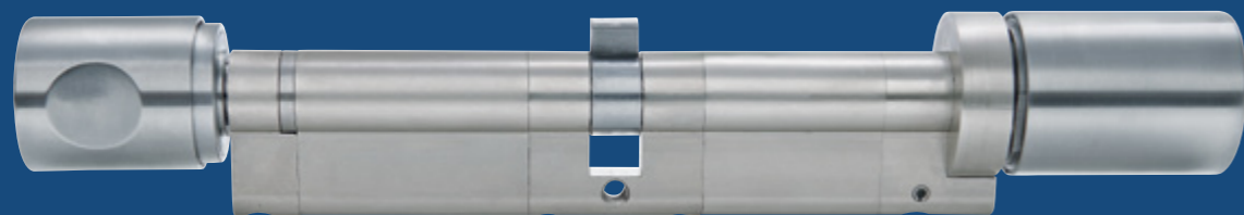
Geeignet für Paniktüren

ABUS Seccor sieht den Sicherheitsbegriff umfassender. Bei ABUS Seccor geht es nicht nur um Sicherheit vor Einbruch, sondern um ein durchdachtes Zutrittskontrollsystem. Dieses vereint eine schnelle Reaktionsfähigkeit bei Schlüsselverlust, die zeitliche Steuerung von Zutrittsrechten, die optionale Protokollierung von Zutritten, die Einbindung der Einbruchmeldeanlage und diverse Sonderlösungen rund um Ihre Türen. So lassen sich auch Paniktüren mit Zylindern der CodeLoxx Serie oder den Zylindern ZL ausstatten. ABUS Seccor realisiert Sicherheit – auch in Ihrem Objekt!