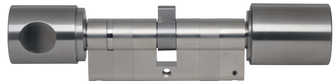
Flexibilität durch Elektronik

Veränderungen in der Berechtigungsstruktur einer Zutrittskontrolle sind die Regel. Unternehmen sind im Wandel, und im Personalwesen wird das besonders deutlich. Es werden neue Mitarbeiter eingestellt, und andere verlassen das Unternehmen. Dieser Wandel ist normal, und ein modernes Schließsystem sollte dieser Herausforderung gewachsen sein. Darüber hinaus gibt es personenbezogene Anforderungen, die realisiert werden müssen: Mitarbeiter, die nur zu bestimmten Zeiten das Unternehmen betreten dürfen, oder ein nicht zurückgegebener Schlüssel, der schnell gesperrt werden muss.